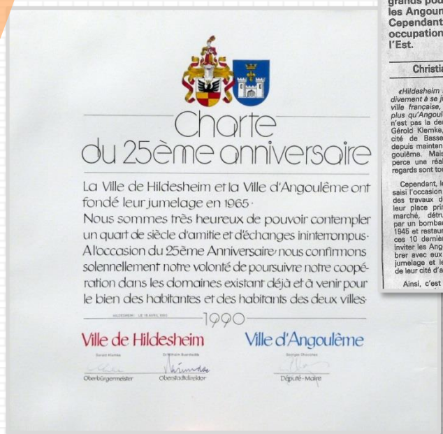
Charente Libre 20 avril 1990