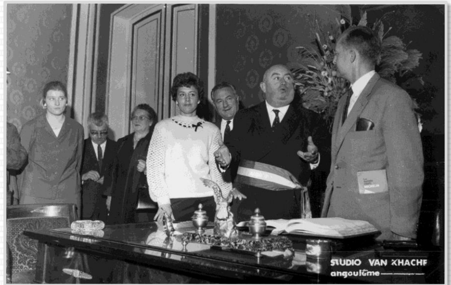
1966 : le Maire d'Angoulême reçoit son homologue de Hildesheim