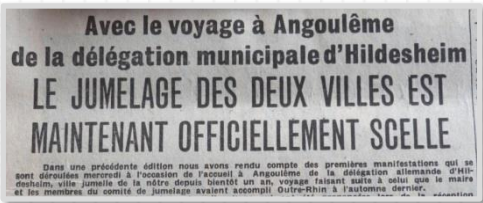
Charente Libre 15 avril 1966